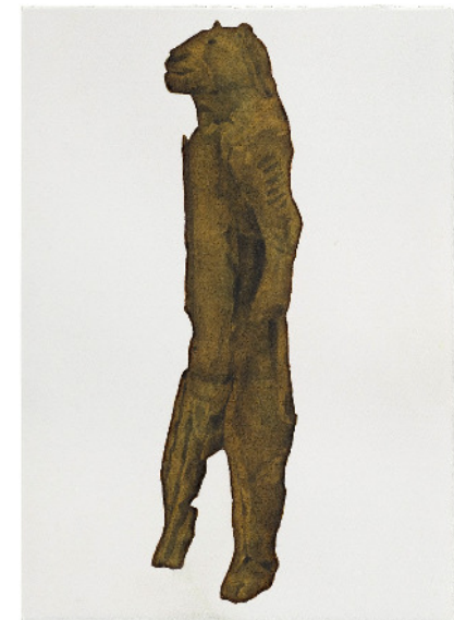
Löwenmensch; ca. 40 000 Jahre alt, Lonetal, aus: Herbert Maier, Visuelle Bibliothek, Aquarell

Herbert Maier findet seine Motive in Bildbänden und Kunstkatalogen, in Zeitschriften, im eigenen Bildarchiv und im Internet. Er überträgt das zuvor scharfkantig aus dem Kontext isolierte Motiv mit Aquarellfarbe in immer das gleiche Format und verfremdet es anschließend, indem er transparente Lasuren darüber legt. Mit diesem Kunstgriff entstehen Differenz und Vergleichbarkeit zugleich. Blatt für Blatt, aufgereiht auf langen Leisten präsentiert, entsteht eine unmittelbare Nähe und Parallele der unterschiedlichsten Menschen aus den unterschiedlichsten Kulturkreisen und Zeiten. Maiers Speicher-Idee vermag das Ungleichzeitige zusammenzubringen, eröffnet eine Reflexion, die niemals abgeschlossen und vollständig sein kann und gerade darin in die Zukunft gerichtet ist.